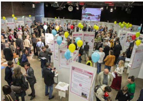
Kooperatives Verfahren Parkstadt Süd, Köln 2015-2017