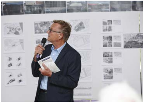
Bürgerwerkstatt Viktoriakarree, Bonn 2016-2017