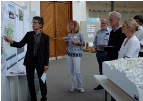
Wettbewerb Neubau Kultur- und Heimathaus, Blankenberg 2017-2019