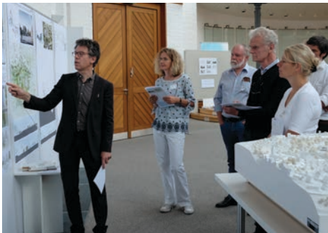
Wettbewerb Neubau Kultur- und Heimathaus, Blankenberg 2017-2019