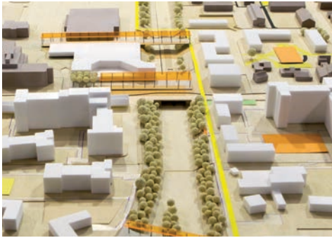
Neue Mitte Tannenbusch Neugestaltung Oppelner Straße 2015-2016