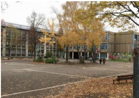
Neubau Frida Levy Gesamtschule, Essen 2021-2023