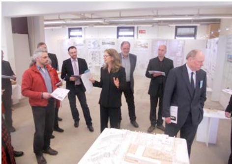
Neubau Gesamtschule, Hürth 2012-2014