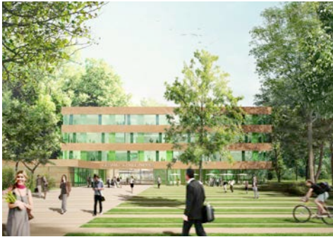
Neubau Gesamtschule Nippes, Köln 2012